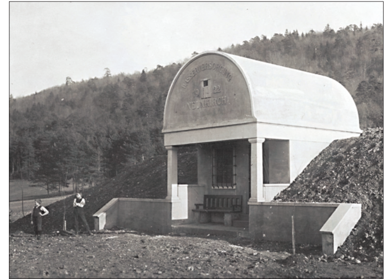
Die sakral- oder tempelartig wirkende Gestaltung zeigt die Wertschätzung der keimfreien Trinkwasserversorgung als denkwürdige Errungenschaft